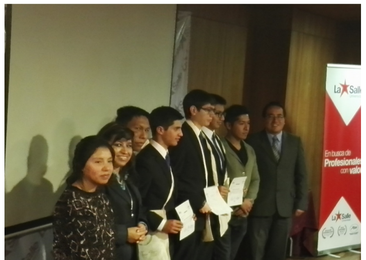
Estudiantes del Colegio Cumbre Recibiendo la distinción al Primer Lugar

En la Segunda Competencia Intercolegial ACM-ICPC 2016: